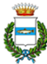
COMUNE DI PESCAGLIA